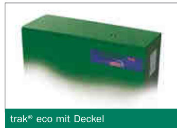
trak ® eco mit Deckel

Durch das HOPPECKE trak ® eco-Konzept werden die Wartungsintervalle maximiert und dadurch eine nahezu Wartungsfreiheit der Batterie erreicht.