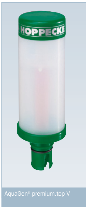
AquaGen® premium.top V

Der AquaGen® premium.top-Rekombinator wird als externes Bauteil auf der Batterie installiert. Dadurch wird ein Temperaturanstieg in der Batterie ausgeschlossen. Die Trennung der Rekombination von den aktiven Bauteilen der Batterie ermöglicht die Reduzierung des Wartungsaufwandes analog zu verschlossenen Batterien, ohne Reduzierung der Gebrauchsdauererwartung und ohne Einschränkung der Betriebsbedingungen.