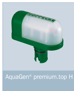
AquaGen® premium.top H

Für Kapazitäten bis 340 Ah sowie für Anwendungen mit abmessungsbedingten Einschränkungen (wie Höhe in Bezug auf die Batterieaufstellung sowie Tiefe in Bezug auf das Zellenmaß) ist die Ausführung AquaGen® premium.top H verfügbar.