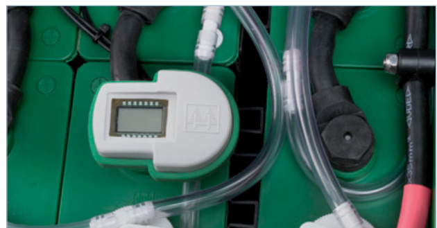
Batterie-Identifikationsmodul trak ® com IP