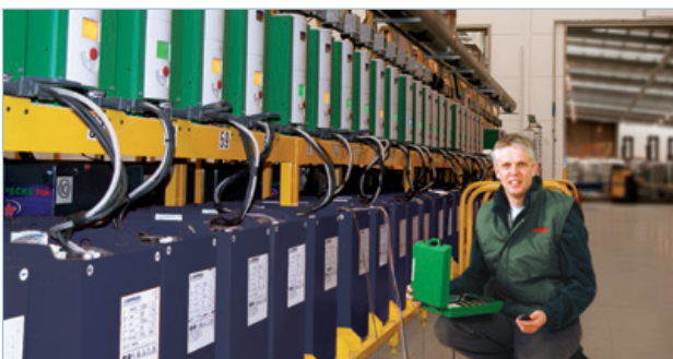
PC-gesteuerter Datenaustausch in einer Ladestation

Der Batterieelektrolytstand wird überwacht und bei Wasserbedarf dem Betreiber die Nachfüllnotwendigkeit signalisiert. Das Batterie-Identifikationsmodul trak ® com IP ist immer nachrüstbar.