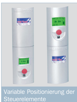
Variable Positionierung der Steuerelemente