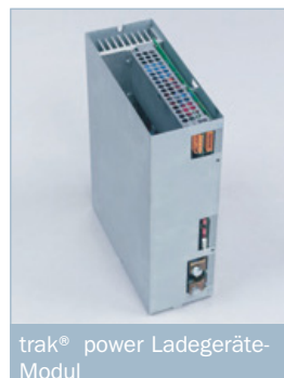
trak ® power Ladegeräte-Modul