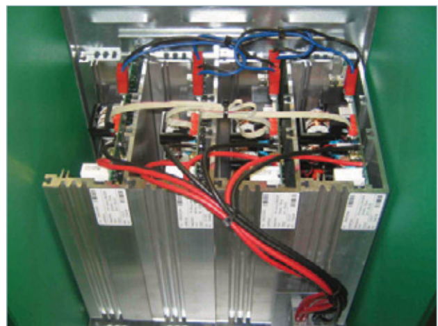
Parallel geschaltete Power-Module, Gerät geöffnet

Alle Geräte der Baureihe sind nach aktuellem EMV-Standard geprüft. Jedes einzelne Modul ist zusätzlich durch Primär- und Sekundärsicherung geschützt.