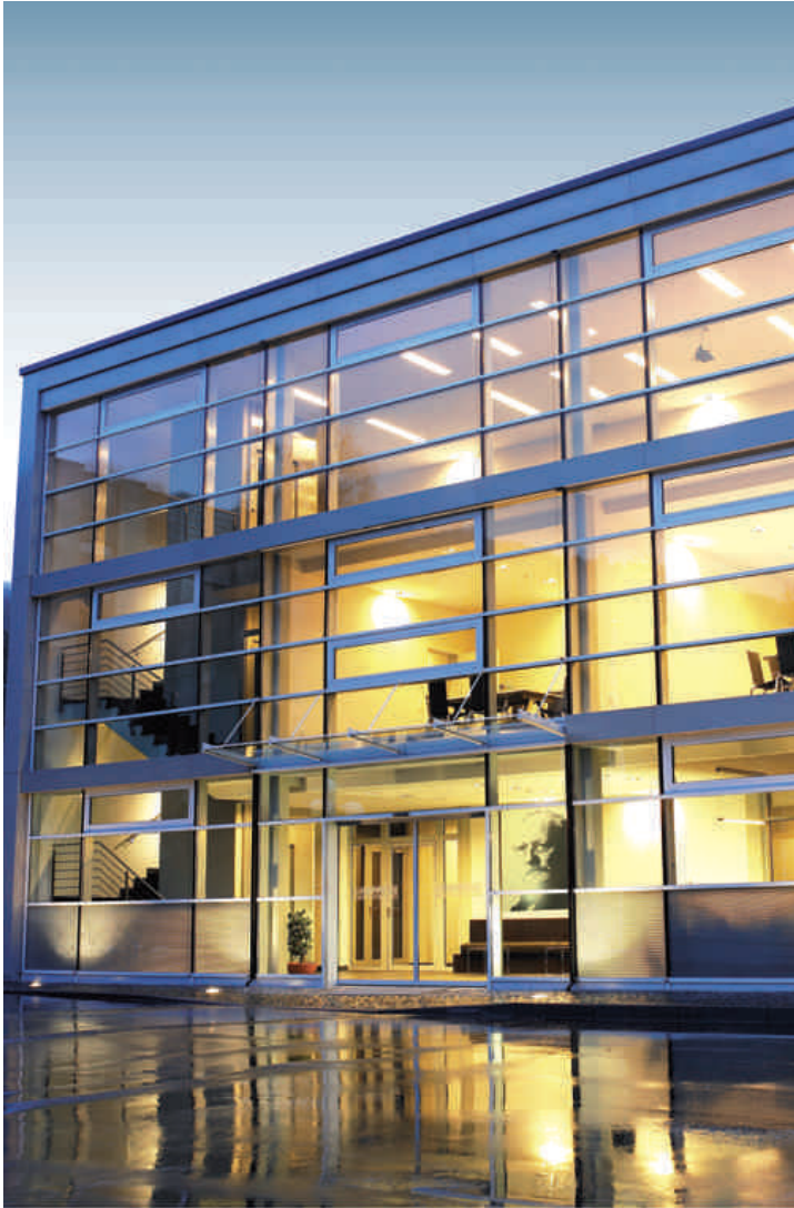
HOPPECKE Unternehmenszentrale in Brilon