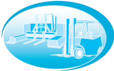
Motive Power Systems