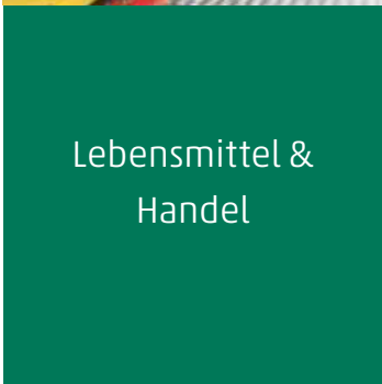
Lebensmittel & Handel