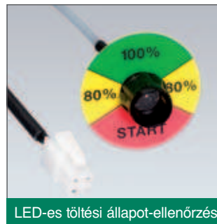
LED-es töltési állapot-ellenőrzés

A fenti méretek biztosítják az Európában alkalmazott raklapemelő kocsik széleskörű lefedettségét.