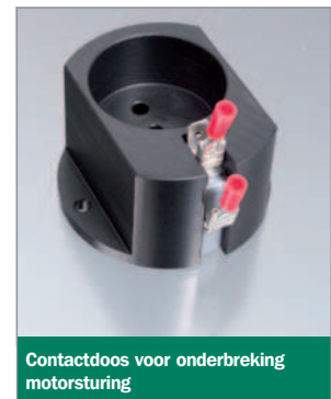
Contactdoos voor onderbreking motorsturing