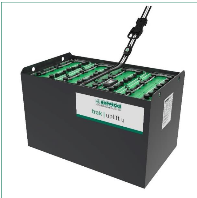
trak | uplift iQ (mit trak | collect Monitoringsystem)